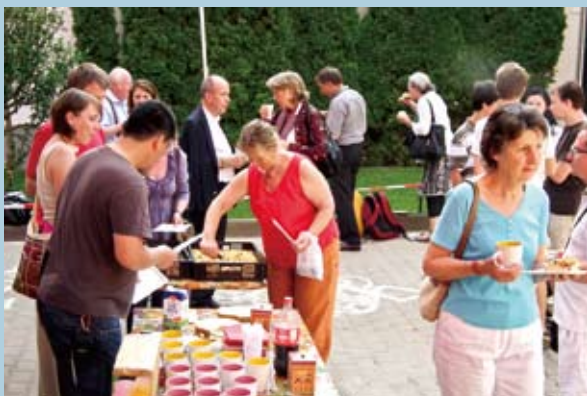
甘登寺的佛友為法王來臨舉辦歡迎午茶。

隨後，法王轉至德國法蘭克福（Frankfurt），造訪薩迦甘登寺。薩迦甘登寺為法王姊姊傑尊姑秀仁波切在德國新成立的道場，大殿可容納三百人，法王在此給予普巴金剛大灌頂並為薩迦甘登寺舉行開光典禮。隨後法王在法蘭克福西藏文化中心給予尊勝佛母灌頂，七月二日搭乘火車前往柏林（Berlin）索甲仁波切中心。