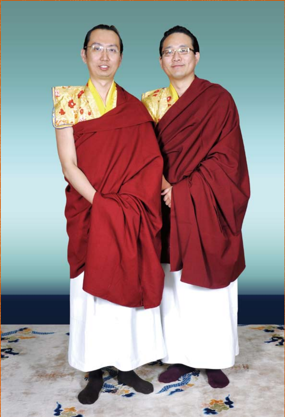
大寶金剛仁波切和智慧金剛仁波切新年合影