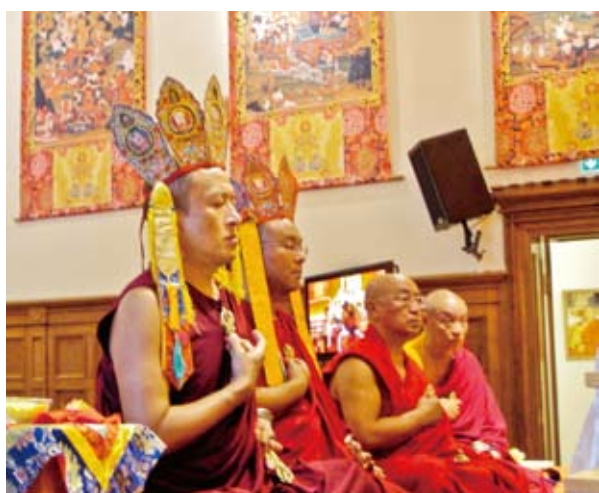
↑ 宗薩欽哲仁波切、吉美欽哲仁波切及貝瑪旺嘉仁波切一同接受普巴金剛大灌頂。

林的本覺會（Rigpa Berlin Centre），當時該中心還是一處只能容納五、六十人的小公寓，如今中心已是一座高達五層樓的建築，大殿可容納五百人，有可媲美五星級飯店