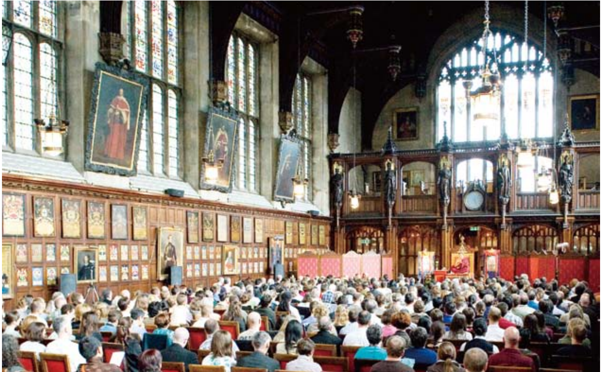
↑ 法王在倫敦一教堂內傳授《遠離四種執著》 在法王的加持下，教堂滿溢著佛教無礙的智慧與慈悲，跟西方文化的開放圓融相映。

法王先在瑞汀傳授了阿彌陀佛頗瓦法及講解，然後到英國南部的伯恩茅斯（Bournemouth），給予喜金剛因灌頂、金剛瑜伽母加持灌頂及向大眾開示「現今世代的佛教」，在那裡停留約一星期，之後應喇嘛