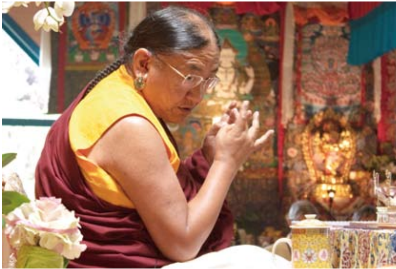
在法國古託塞姆（Kuttolsheim）道果教學實況(一)：法王修法時凝神專注的神態。

道果教學是自印度大成就者畢瓦巴所傳，是薩迦派最重要且不共的教學，包含了顯教義理的「三現分」教學及金剛乘的「三續」教學。三現分包括「不淨現分」，「覺受現分」及「清淨現分」。「不淨現分」講輪迴過患、人身暇滿難得，以令行者對輪迴產生厭離而生起出離心；「覺受現分」講授慈