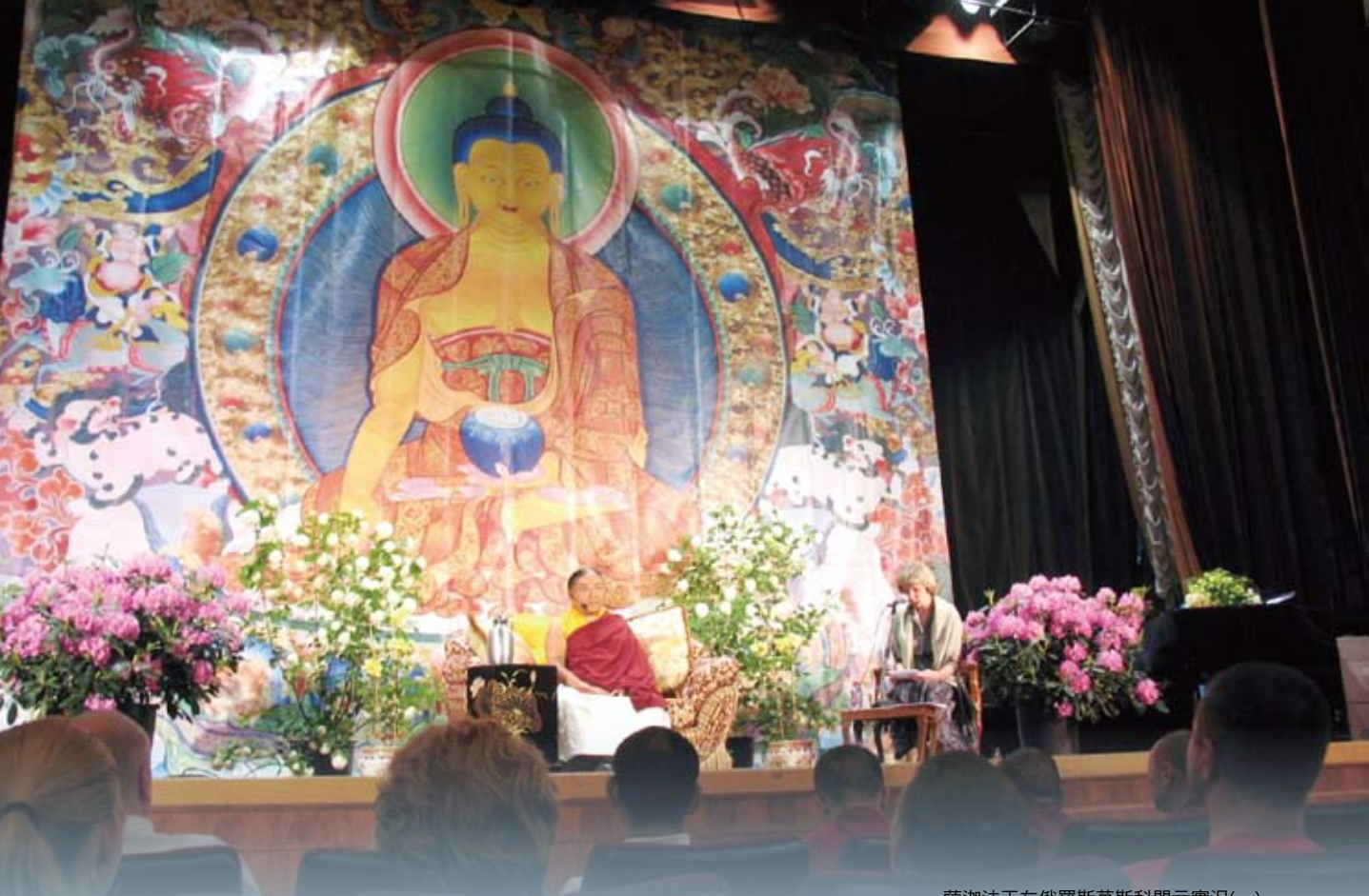
薩迦法王在俄羅斯莫斯科開示實況(一)