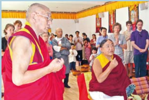
法王在德國法蘭克福（Frankfurt）為薩迦甘登寺舉行開光典禮。