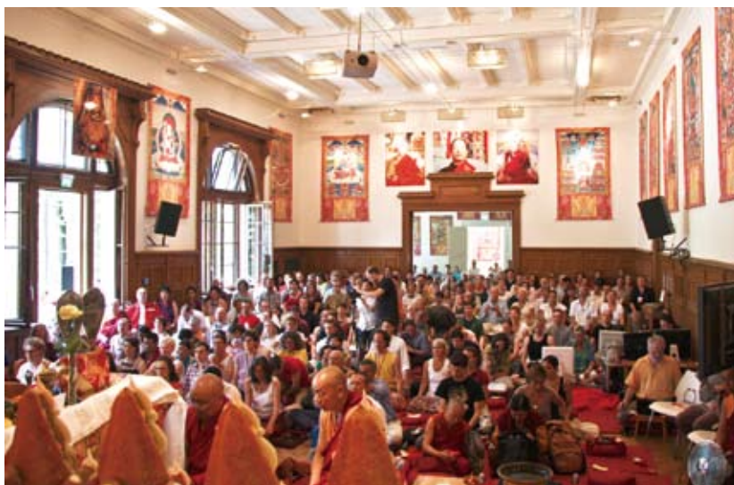
法王在柏林（Berlin）的明覺會傳授普巴金剛大灌頂。

7月4至5日在本覺會傳授普巴金剛大灌頂，當時正在柏林弘法的宗薩欽哲仁波切及吉美欽哲仁波切及貝瑪旺嘉仁波切都一同接受此殊勝的昆家族普巴金剛大灌頂。7月6日法王前往柏林本覺會的安養中心預定地給予加持，本覺會才