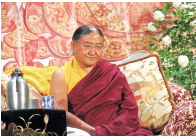
薩迦法王在俄羅斯莫斯科開示實況(二)

2010年初夏，眾生依怙薩迦法王展開歐洲弘法之旅。首站法王一行抵達俄羅斯莫斯科（Moscow），給予「佛教哲理及薩迦傳承簡介」的開示，並傳授菩薩戒和喜金剛大灌頂及教學。第二站來到俄羅斯艾利斯塔（Elista），給予金剛瑜伽母加持灌頂及教學，另授予「金剛手、馬頭明王、大鵬金翅鳥三合一灌頂及教學」（Tak-Cha-Kyung Sum）。