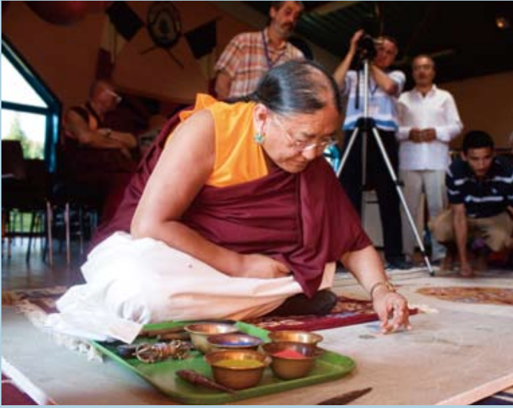
在法國古託塞姆（Kuttolsheim）道果教學實況(三)：薩迦法王親自繪畫喜金剛沙壇城。

中心（Salle Polyvalente）舉行，有來自世界各國的學員包瑞士、匈牙利、瑞典、法國、英國、德國，以及從澳洲、南美洲、加拿大、美國、中國、台灣等地遠道而來的信眾匯聚一堂，就像一個聯合國。古託塞姆的前後任市長當天蒞臨致詞，現任市長表示，當地居民雖然多為基督徒，但對佛教擁有極好的印象。過去法王在1984年及2002年就曾在這裡給予道果教學，今年又在同一地點傳授道果，當地居民早已將這活動中心視為佛教寺院。