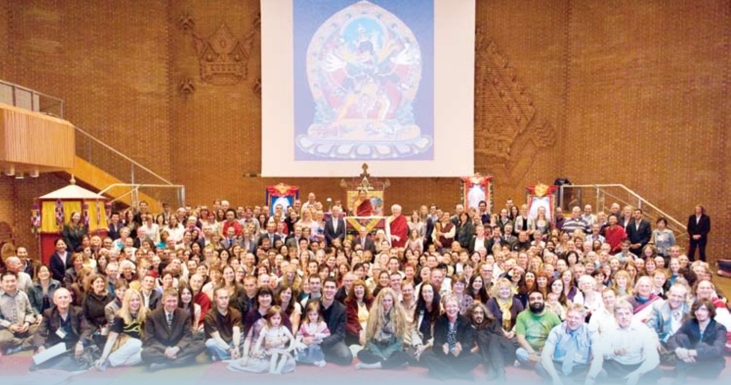
法王和參與時輪金剛灌頂的信眾合照