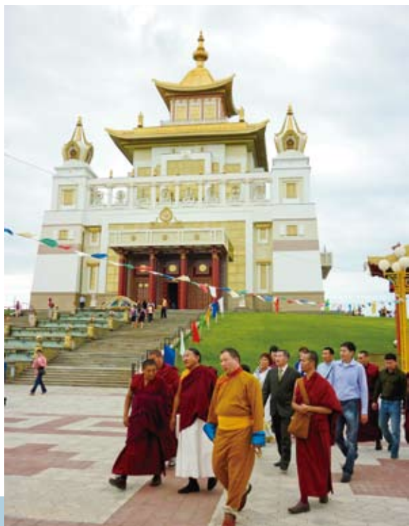
↑ 法王及弘法團在俄羅斯艾利斯塔（Elista）充滿特色的藏傳佛教寺廟外留影。

厚的淵源。當地州政府為了弘傳佛法，還特別斥資興建一座藏傳佛教寺廟，因寺廟較周邊的建築物高聳且甚具特色，遠眼望去就能見到它的莊嚴雄偉。對此，艾利斯塔州政府除了希望這座寺院能成為當地的精神信仰中心外，也冀盼這座寺院能成為當地最具代表