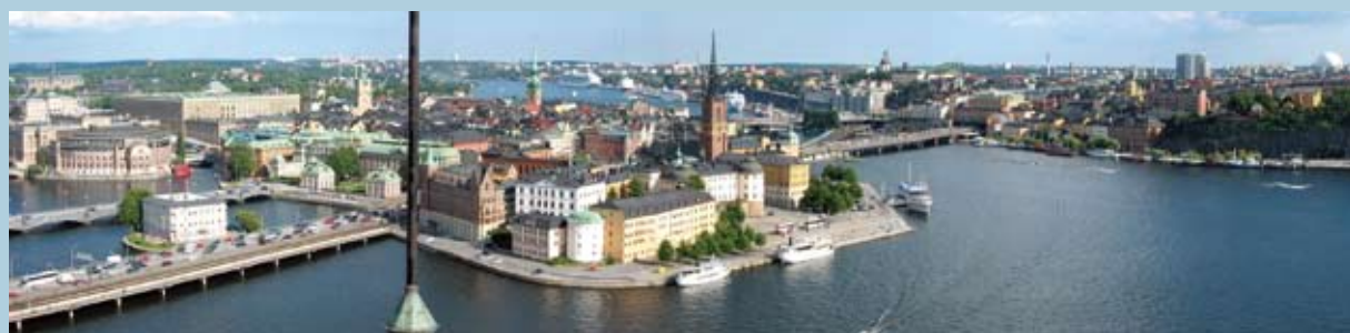
↓ 日間的斯德哥爾摩（Stockholm）。