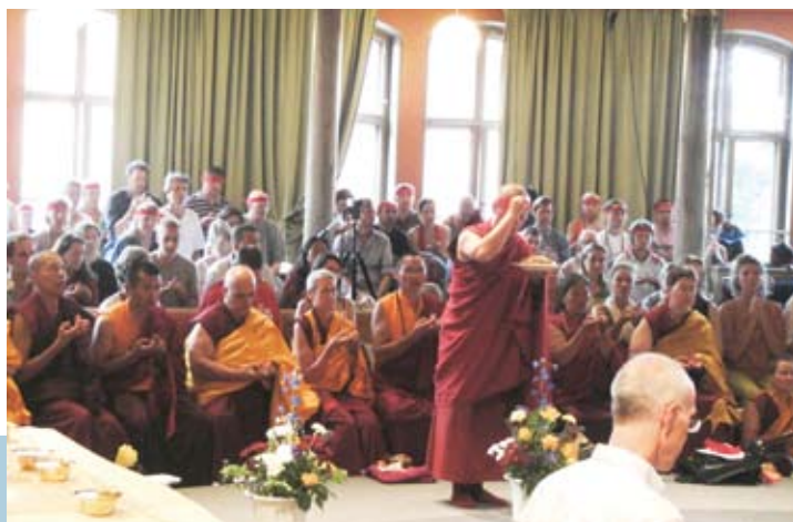
↑ 法王在瑞典斯德哥爾摩（Stockholm）給予時輪金剛大灌頂實況。

雨勢歇止後，烏雲散去，碧空如洗，鳥鳴婉轉，小鎮上一座座傳統小屋讓人宛如置身童話。沿著古託塞姆小鎮上的酒鄉之路漫步，到處是淡紫、粉橘的童話式建築，窗台上栽植著豔紅、紫、粉、鵝黃的鮮花，空氣中揚散著果香及禾草的芬芳，小徑旁麥穗搖曳，玉米果實正在抽長，充滿甜度與水分的葡萄沉甸甸地掛在果樹上；這裡的村民也非常和善，走在路上，迎面而來的路人總是報以溫煦的微笑，親切用法文問候「你好」，法王就是在如此美麗而溫馨的小鎮傳授道果教學，實在是眾生的福報。