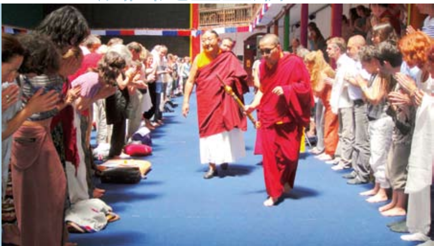
↑ 給予時輪金剛大灌頂，法王步入會場。