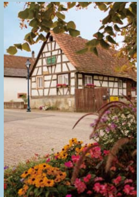
古託塞姆(Kuttolsheim)小鎮一景。