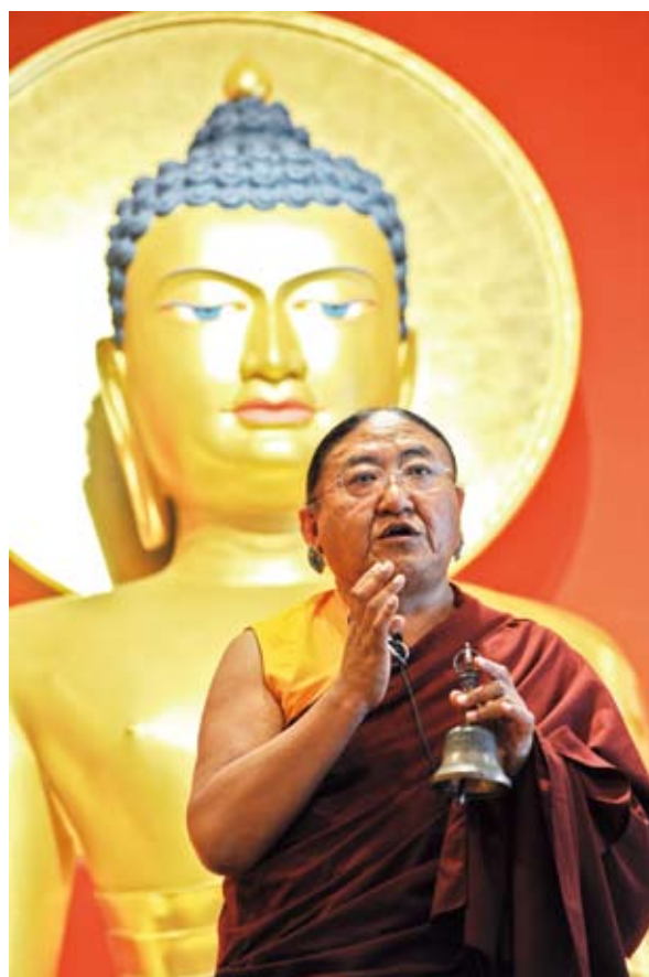
→ 法王在索甲仁波切於德國柏林（Berlin）的明覺會傳授普巴金剛大灌頂。