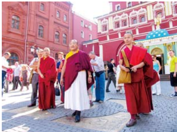
法王及弘法團在莫斯科紅牆觀光，察看城市十五年來的轉變與現存面貌。

性的地標，一如印度的泰姬瑪哈陵或西藏的布達拉宮，可見當地極為重視佛教文化，這或受蒙古人向來重視佛教的薰陶所染。