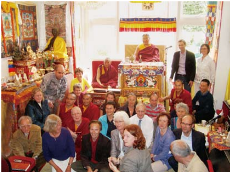
法王在荷蘭海牙傳授白度母灌頂與教學。