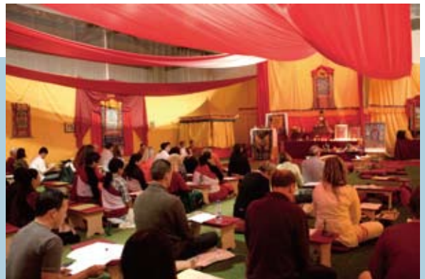
在伯恩茅斯(Bournemouth)舉行喜金剛大灌頂。

法王先在瑞汀傳授了阿彌陀佛頗瓦法及講解，然後到英國南部的伯恩茅斯（Bournemouth），給予喜金剛因灌頂、金剛瑜伽母加持灌頂及向大眾開示「現今世代的佛教」，在那裡停留約一星期，之後應喇嘛