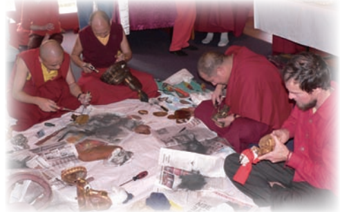
喇嘛在薩迦國際佛學院為佛像裝藏。