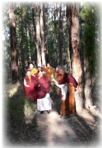
SIBA閉關中心恭迎法王。