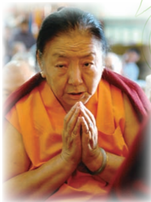
法王的姐姐－傑尊姑秀仁波切