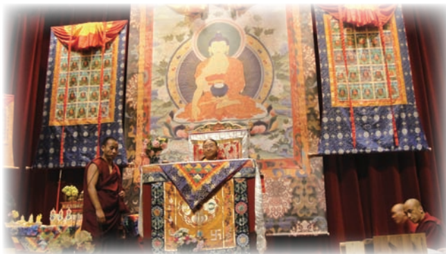
墨爾本灌頂法會現場一景。

6月17日我們從凱恩斯經由布里斯本飛往阿德雷得，在阿德雷得停留了二天，主辦單位在阿德雷得租借一所教堂做為弘法據點。薩迦法王給予「遠離四種執著」的教學及文殊菩薩的灌頂。由於藏曆5月18日（西曆6月17日）正逢「哦千」圓寂紀念日，薩迦法王於舉行上師瑜珈薈供。