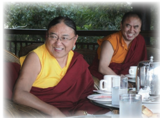
凱恩斯渡假旅館-歡樂的下午茶。