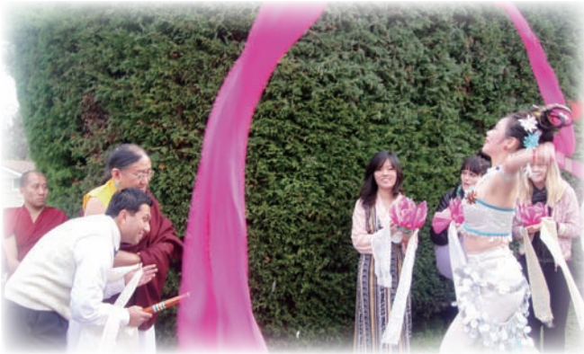
在紐西蘭跳天女下凡，歡迎法王。