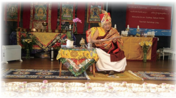
薩迦法王在傑古佛學中心給予菩薩戒。

墨爾本的活動是由薩迦法輪中心與薩迦大慈中心所共同舉辦。他們承租了市政府的大禮堂做為弘法據點。薩迦法王給予八思巴祖師開示－佛法的贈禮、長壽佛灌頂。