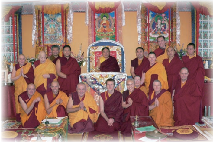
SIBA閉關中心與僧眾合影。