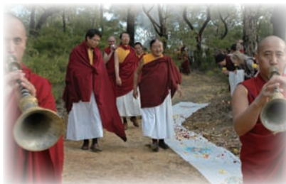
卓密閉關中心恭迎法王與二位法王子。