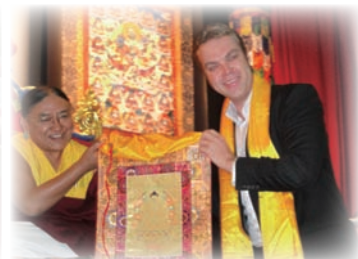
法王賜贈唐卡給Balmain市長。