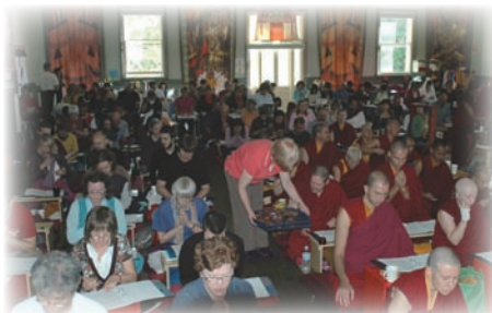
道果教學實況一景。