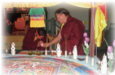
傑尊姑秀進入喜金剛壇城，接受薩迦法王加持。