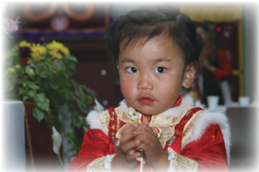
法王孫女－傑尊瑪仁波切。