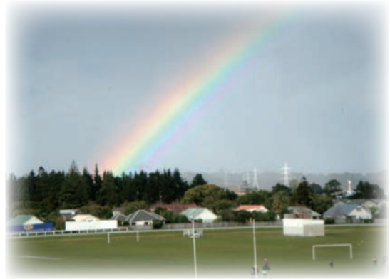
薩迦法王在紐西蘭給予憤怒蓮師灌頂時，天現彩虹多次。