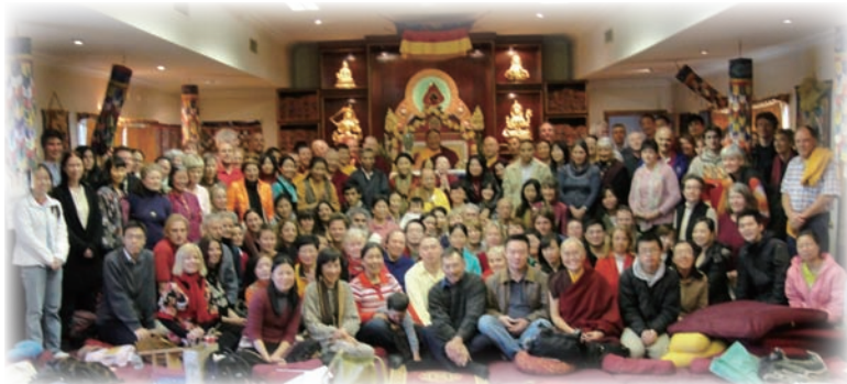
薩迦法王和薩迦塔巴林會員們合影。

7月11日由卓密閉關中心，以及全澳所有薩迦中心，一起在Balmain市政會議中心，給予祝禱薩迦法王健康長壽的長壽法會，晚上舉行歡送晚宴，在歡送晚宴中，我們結束了二個半月的紐澳弘法行程，7月13日搭乘新加坡航空公司前往新加坡弘法。