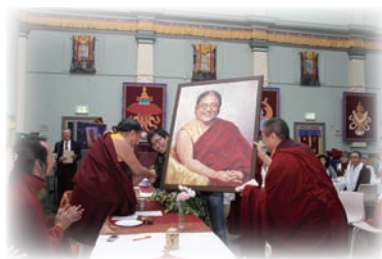
信眾供養法王畫像。