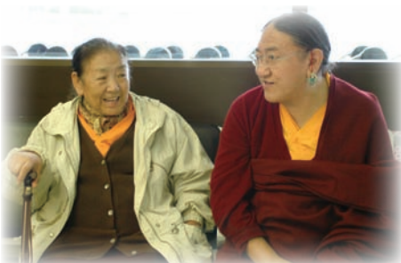
薩迦法王與傑尊姑秀仁波切在雪梨機場合影。