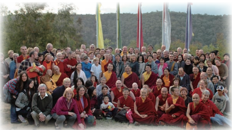
卓密閉關中心合影。