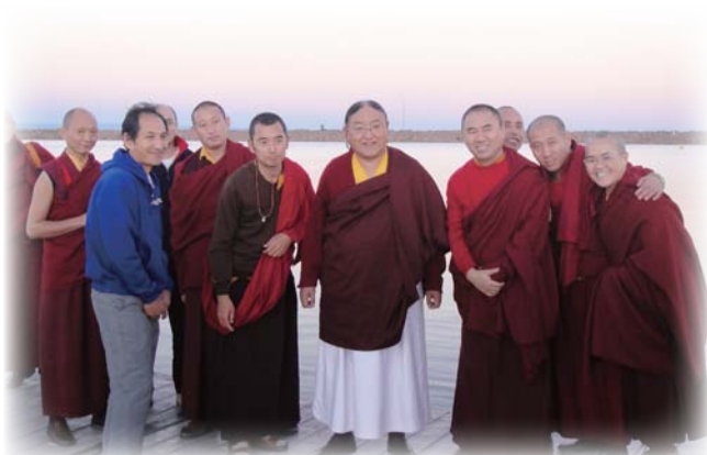
法王與隨行侍者在乖亞拉海邊。