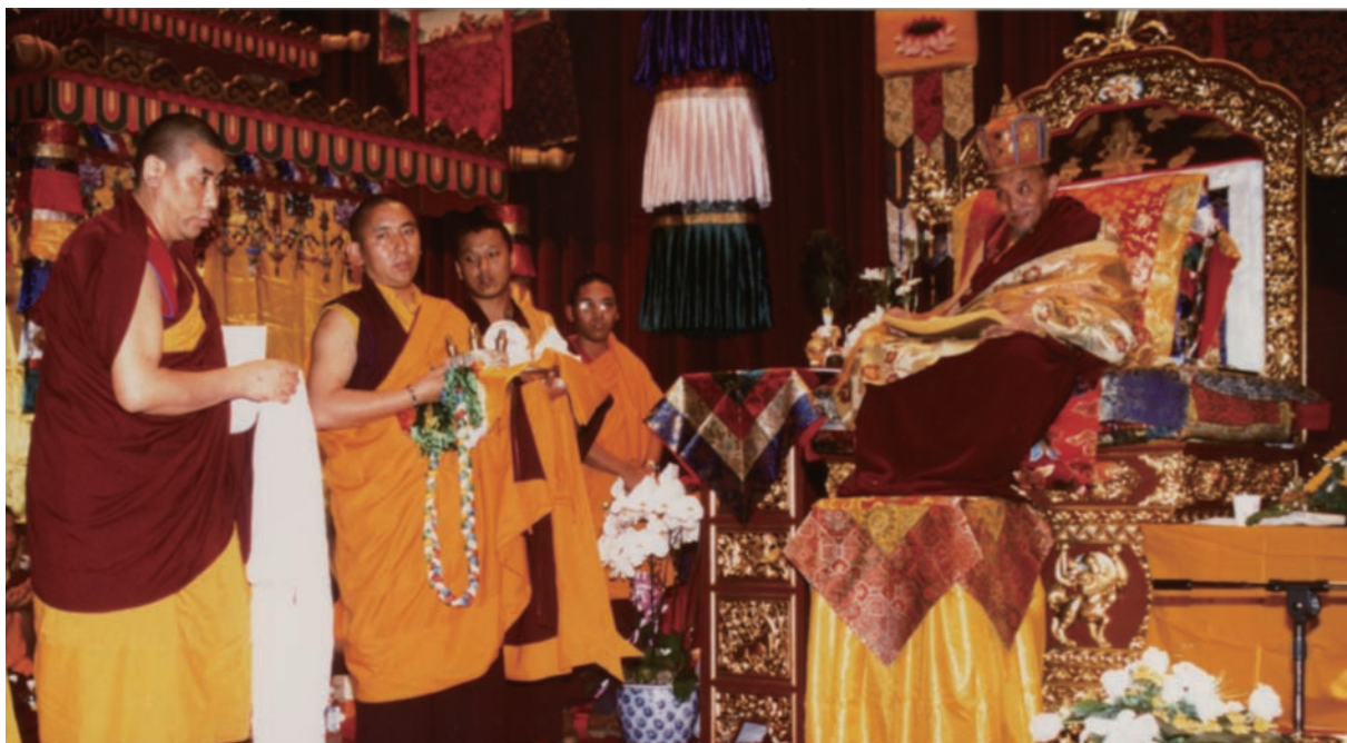
1999年究給企謙仁波切在台北世貿國際會議中心傳授時輪金剛大灌頂。

每 當一位偉大的上師往生，弟子們人人感到悲悽、心碎，其他的上師、喇嘛們也痛悼明師殞落。每當有大修行者往生，我個人總會深深惋惜。其實在一位大修行人往生前，總會有若干徵兆出現，而且往往透過占卜的方式可以得到證實。