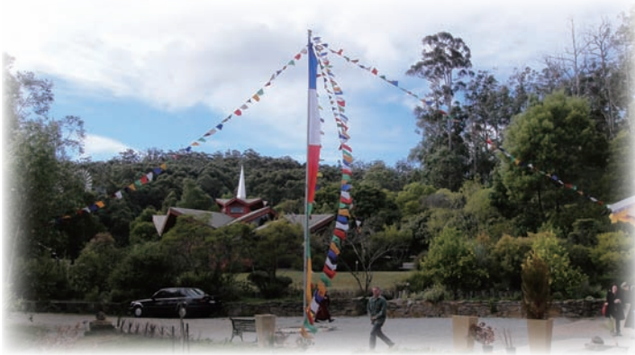
薩迦國際佛學院一景。