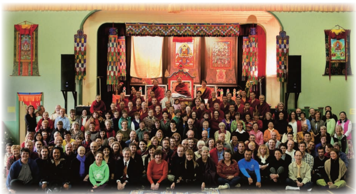
2009澳洲雪梨薩迦法王與全體學員合影。