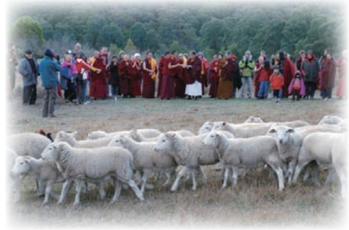
放生綿羊並為其祝福。