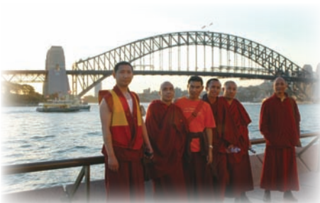
喇嘛們在雪梨海港前合影。