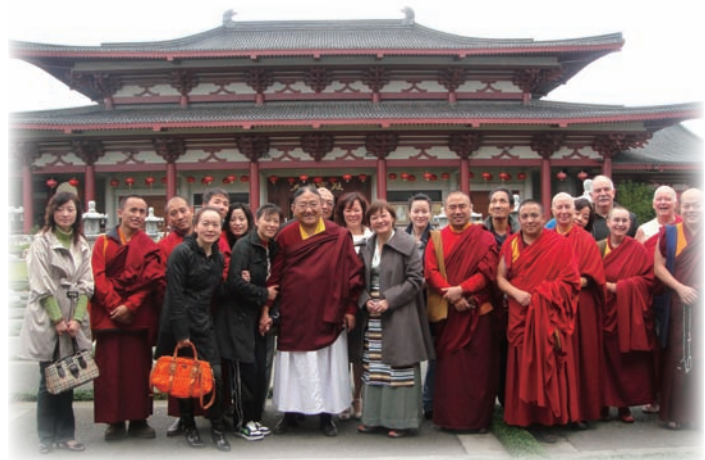
紐西蘭佛光山別院合影。