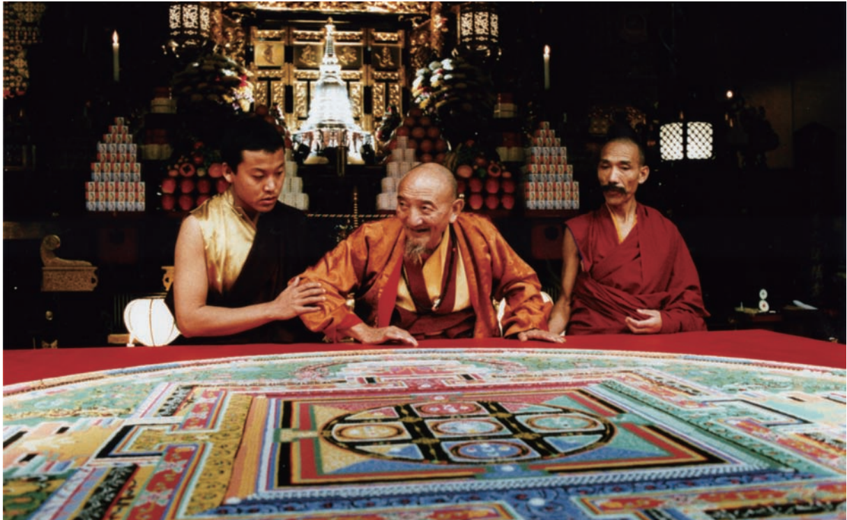
1994年究給仁波切在日本傳授大日如來大灌頂。

剛，或金剛瑜珈母。喜金剛傳承中我們則觀想上師為金剛總持或喜金剛。就這樣，我們從真實觀照開始，以完全的清淨心觀想上師及其週遭境界。如此，信心的根本就是上師—以圓滿正覺之形相示現—的清淨見。