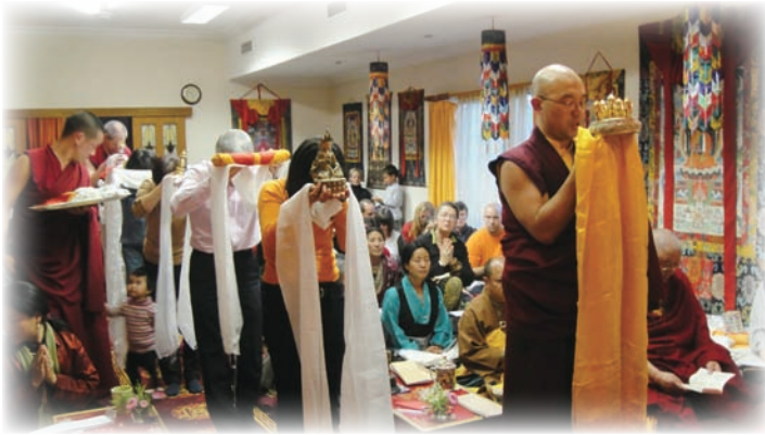
董居仁波切在薩迦塔巴林供曼達給法王。