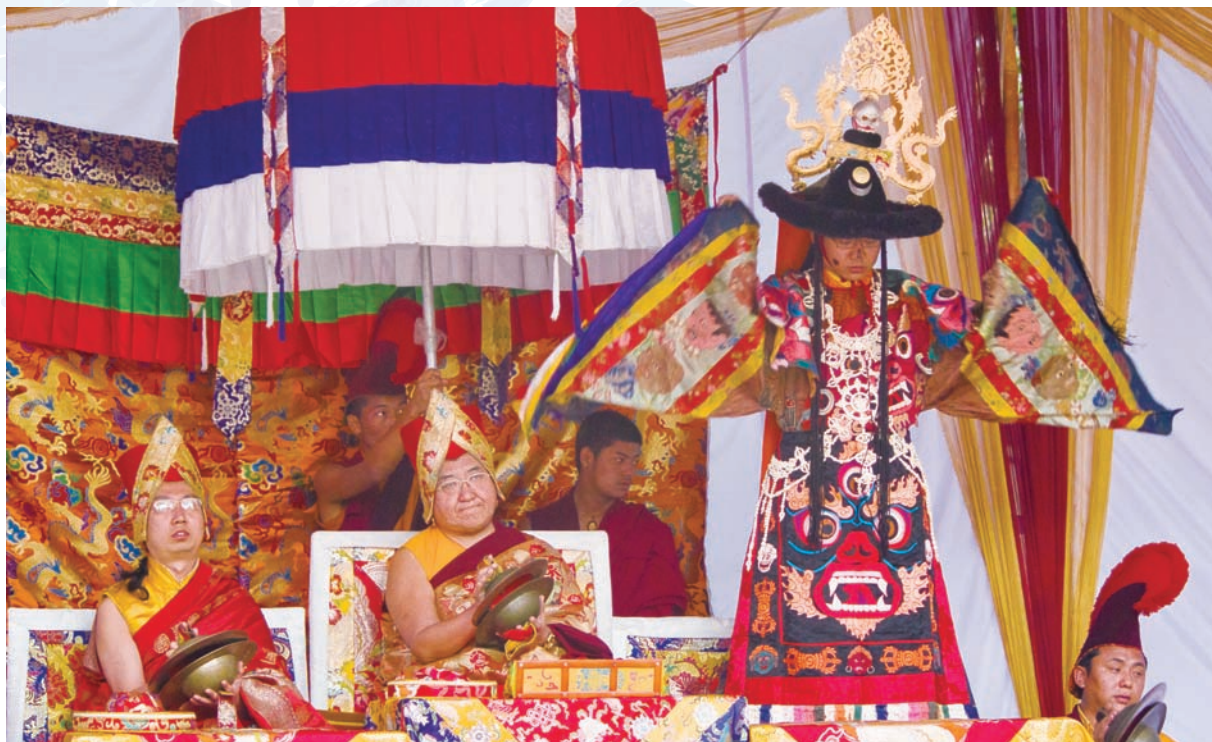
普巴金剛除障大法會實況