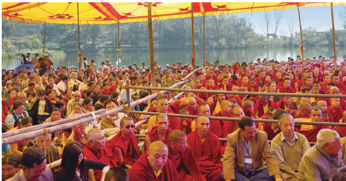
於蓮師湖畔舉行長壽佛灌頂

法王開示有關措佩瑪「蓮師聖湖」的故事來源：說了曼都拉娃的傳奇事蹟，古代紮霍日Shastradhara王的故事。Shastradhara王與王后育有一女曼都拉娃公主。公主乖巧貼心，國王、王后十分寵愛。公主善良、美麗、大方得體、受良好的教育、信仰虔誠，她的種種優點，使其他眾多國王為之傾心。但國王、王后遲遲無法決定駙馬人選，配選任一國王，其它國王將忿忿不平。於是他們詢問公主本人，公主卻堅定拒婚。她認為輪迴是苦，希望能出家為尼，致力修行，最後