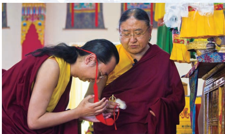
法王子大寶金剛仁波切在法王座前領受灌頂

迦女的修持有三種傳承；這次法王傳授的屬於那諾卡雀傳承，是由金剛瑜伽女直授那洛巴大師，那洛巴大師再傳予二大弟子尼泊爾龐亭兄弟。多年後，大譯師瑪洛札哇更將此法傳入西藏，最後傳給薩迦初祖薩千貢噶寧波。喜金剛與金剛瑜伽女已成薩迦派主要修行法門，亦是薩迦十三金法的重要部分。金剛瑜伽女法門殊勝之處，在其容易入門，簡易明瞭。歷代許多上師及行者，皆藉由修持金剛瑜伽女，而証得虹光身。