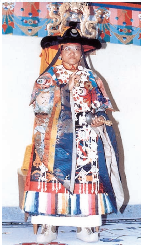
法王身著黑帽舞法袍