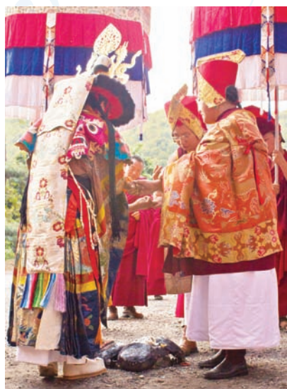
普巴金剛除障大法會圓滿前在薩迦寺作結行

法王、法王子及喇嘛們回到寺院。在寺院門外，挖了一洞，將魔敵俑像遺骸埋藏，並以火供爐旁的巨盤覆蓋。儀事最後，法王，兩位法王子與隨從喇嘛牽手繞盤，以淨化所有一切不吉祥力量。法事儀軌的最後，當信眾散去，法王與兩位法王子回到寺院，今年普巴金剛除障投擲食子大法會就此圓滿。此時一年來所累積的惡業障礙除去，以迎接充滿吉祥、光明的新的一年。