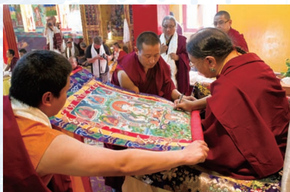
法王為直貢噶舉寺的唐卡簽名開光