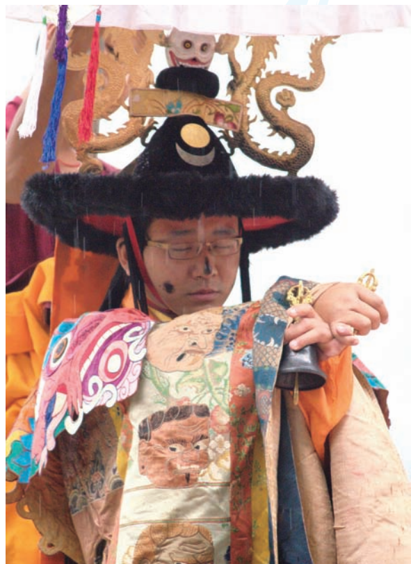
法王子智慧金剛仁波切手持鈴杵調伏魔敵

這時兩名鹿面使者、兩名虎面使者、與兩名馬面使者現身，以助金剛上師一臂之力。他們繞寺舞動，一手持劍、一手握黑鞭，以驅除法界中的不好的磁場及障礙。當儀事結束，這六位使者分別站立於法王子兩側，這時法王子再次高舉供護法之酒，以獻祭諸神。近午時分法王與兩位法王子起身離座，法會將在下午繼續。