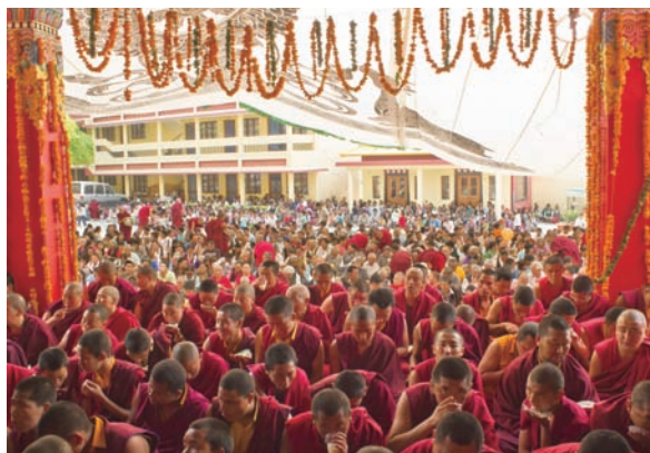
金剛瑜伽女灌頂教學實況