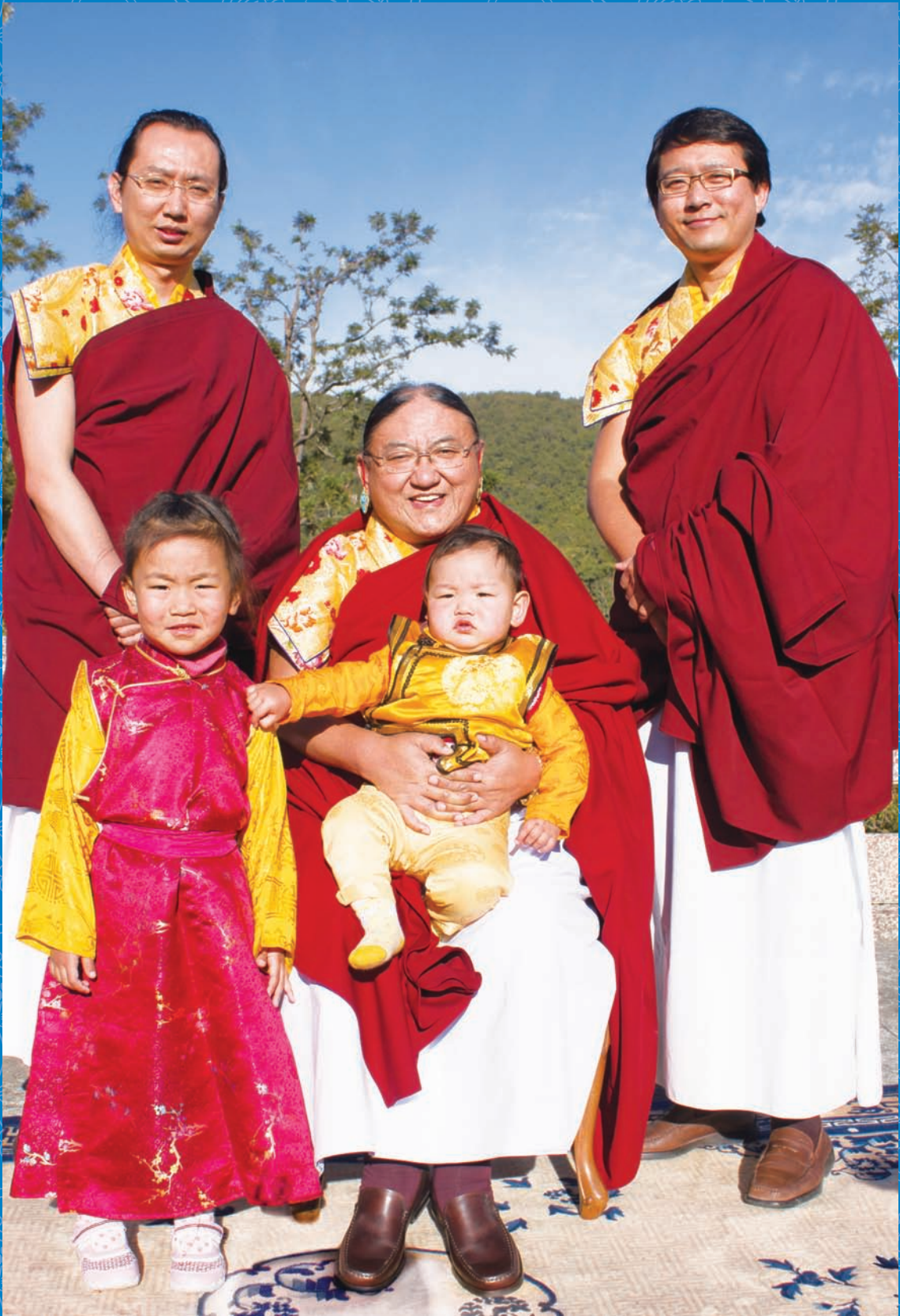
2011藏曆新年薩迦法王、三位法王子和傑尊瑪仁波切合影