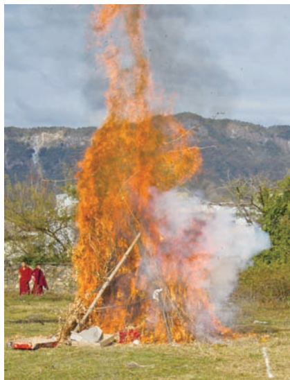
普巴金剛投擲食子法會

接下來，眾人便準備到戶外廣場，五尊魔敵俑像被帶下寺階，被置於三足鼎上，等待火化。法王與法王子大寶金剛仁波切、智慧金剛仁波切，這時自法座起身，由隊伍前方，走到廣場中央，後由護法護送至戶外廣場，舉行最後儀事。到了戶外廣場。智慧金剛仁波切再度主持儀事，以淨化法界中的邪靈，祈請法會圓滿順利，此時四周群山，也賦予了法會莊嚴氣氛。接下來法王子則揮弓舞箭，使魔敵於火光中淨化。弓箭使人聯想