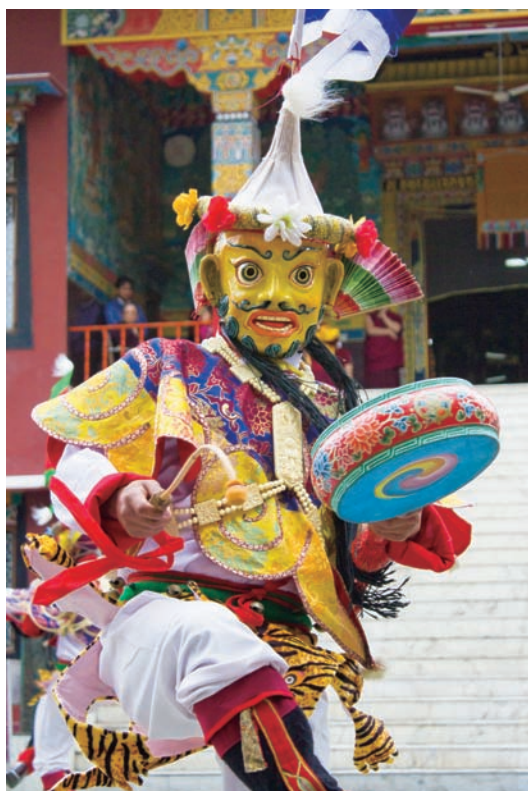
喇嘛行普巴金剛舞

智慧金剛仁波切座前佈置了一張以黑布覆蓋的桌子，上繪有魔敵的剝皮遺骸。上覆蓋三角金屬盤，內盛『林迦：魔敵俑像』，象徵魔敵的血肉之軀，表徵我們凡夫的惡業，是我們受苦的根源，若欲脫離苦海，必先將其斷除。智慧金剛仁波切的主座旁，另擺一張桌子，上置七支特製的普巴金剛杵，用以切割魔敵俑像；另有金剛鈴杵，智慧金剛仁波切持鈴杵在魔敵俑像上結手印，以降伏魔眾；另有一些小頭骨灑於魔敵俑像上方以除障，表徵金剛上師斬妖除魔。上師們能藉由禪定之力，將魔眾神識牽引至淨土，而藉由特殊的舞蹈儀事和特殊法器的使用、大手印等，以能淨化我們內外密的種種障礙。