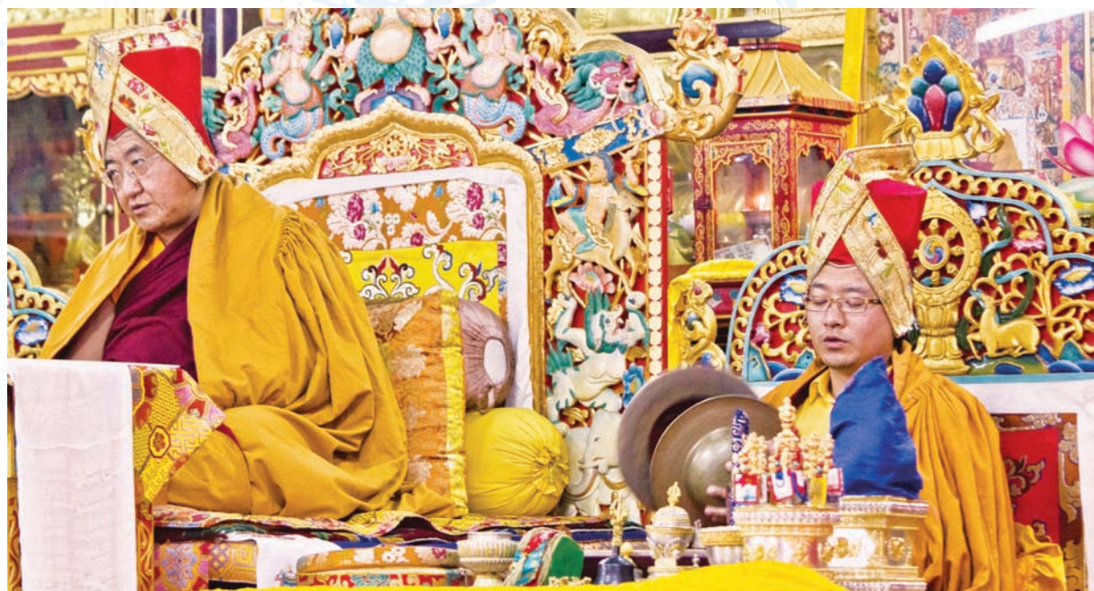
法王與法王子智慧金剛仁波切主持普巴金剛除障成就法會

多瑪儀事，是普巴金剛除障大法會的重要一環。此法會目的主要在除去一年來積累的惡業，以迎接新的一年的到來。