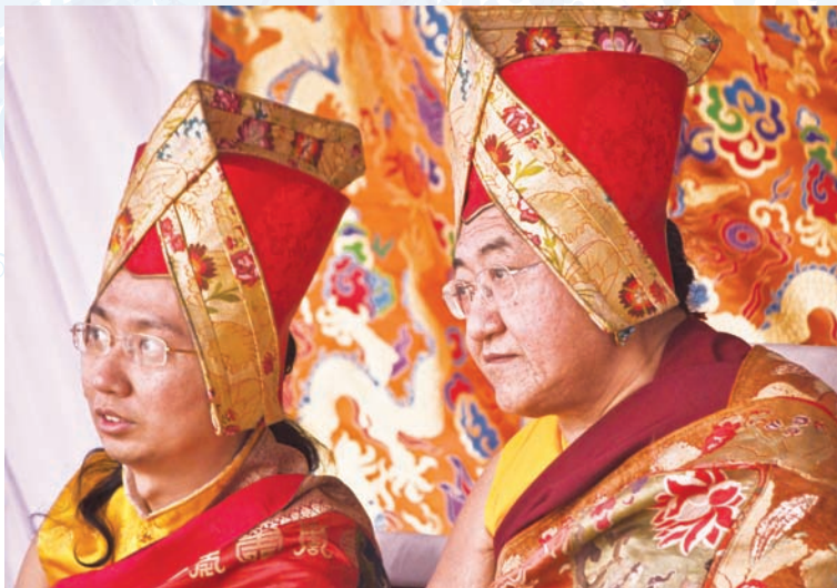
法王與大寶金剛仁波切觀看智慧金剛仁波切主持金剛舞

法會先供養山神地祇，以祈土地山神護祐此次法會順利，跳金剛舞者高舉供甘露聖杯，灑於空中獻祭，供甘露儀事反覆三次。祭祀山神地祇後，智慧金剛仁波切、法王與大寶金剛仁波切重返法座。智慧金剛仁波切在法座主持了淨化儀事，當他高立法座，以一連串儀事淨化法界。而當他高舉雙臂，舞衣的袖套