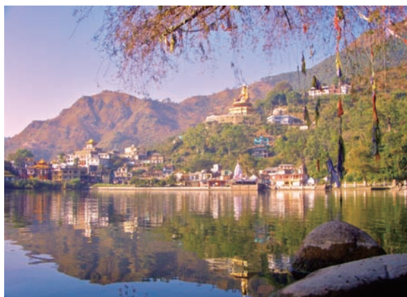
蓮師聖湖措佩瑪全景