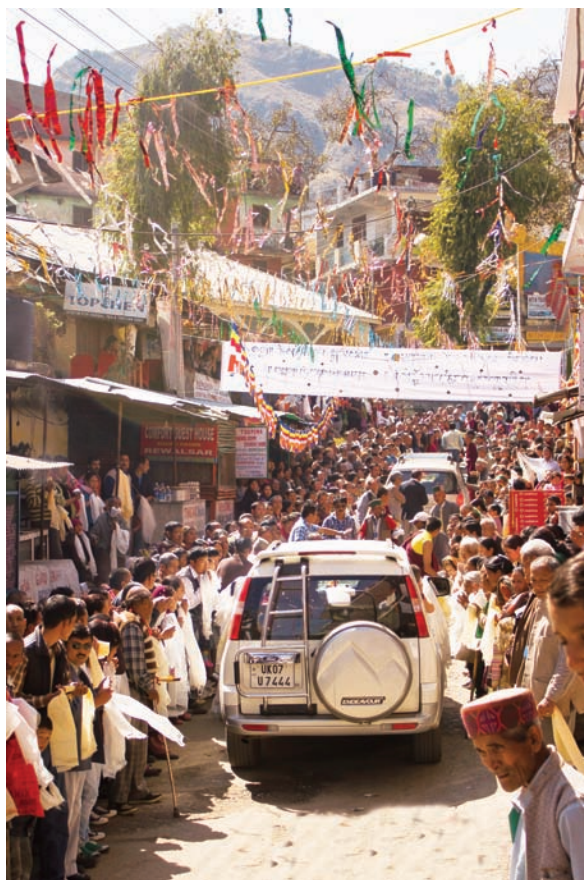
法王抵達寧瑪派寺院

法王與信眾們，這時緩緩走下通往喇嘛拿望津巴寺院。喇嘛拿望津巴寺院因距離遠，且缺乏屏障，使建寺工程困難重重，幸而目前幾近完工。喇嘛拿望津巴是已逝頂果仁波切之侄，以半閉關方式在措佩瑪度過二十年。