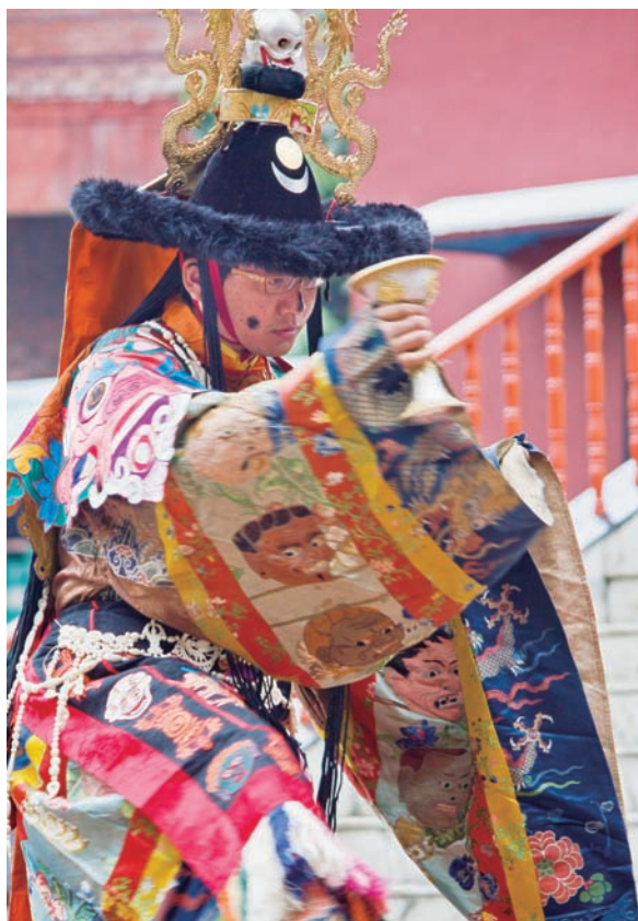
法王子智慧金剛仁波切供智慧甘露予本尊