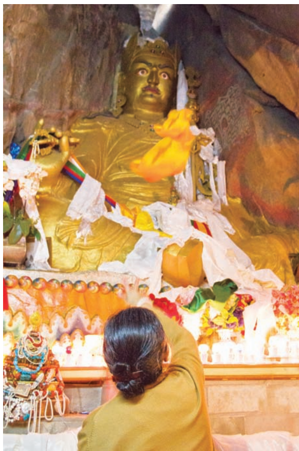
大佛母在蓮花生大士洞內供養卡達